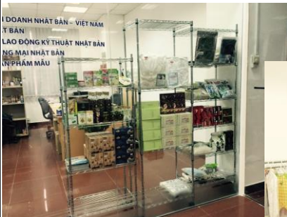
【展示ブースの様子】