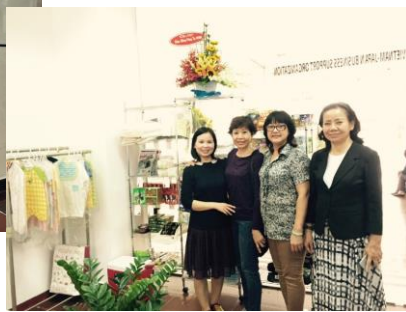
【ベトナム経営者の方々と】